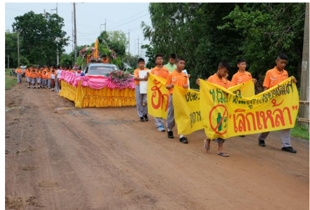
สุรินทร์

เด็ก เยาวชน และประชาชน ได้ทราบถึงความสำคัญของวันทางศาสนา และได้นำหลักธรรม ไปประพฤติปฏิบัติในการดำเนินชีวิต ปลูกฝังค่านิยมหลัก ๑๒ ประการ และใช้พลังบวร (บ้าน วัด โรงเรียน) ขับเคลื่อนให้ชุมชนเป็นสังคมคุณธรรม