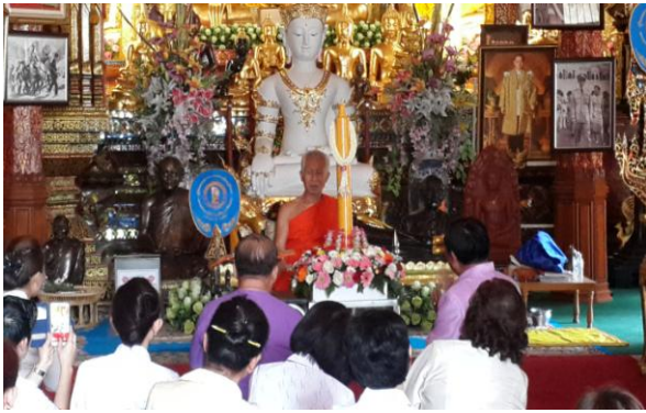
เชียงใหม่