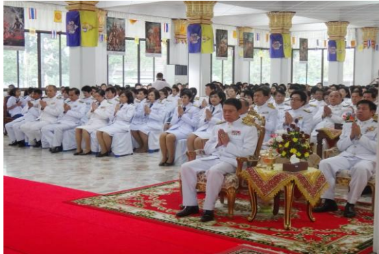
จันทบุรี