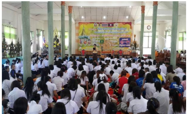
มุกดาหาร

เด็ก เยาวชน และประชาชน สามารถนำหลักธรรมทางศาสนาเป็นหลักในการดำเนินชีวิต ได้เรียนรู้ความเป็นมาของวันสำคัญทางศาสนา เพื่อจะได้ร่วมกันทำนุบำรุงและสืบทอดพระพุทธศาสนา และรู้จักการประพฤติปฏิบัติได้อย่างถูกต้อง เพื่อความเป็นสิริมงคลทั้งต่อตนเอง ครอบครัว