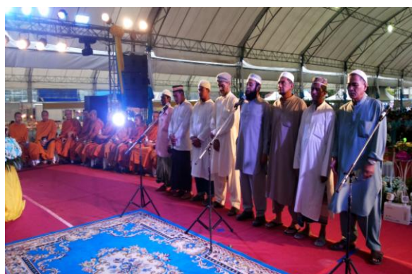
กาฬสินธุ์