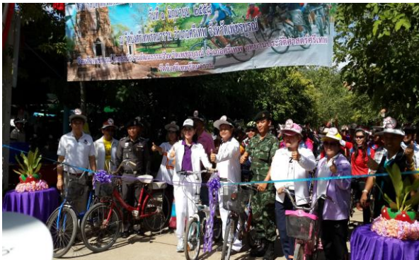
เพชรบูรณ์