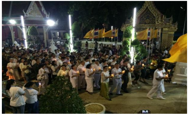
ปทุมธานี