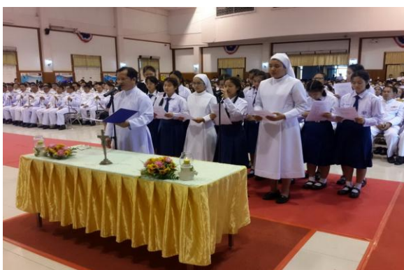
เพชรบูรณ์