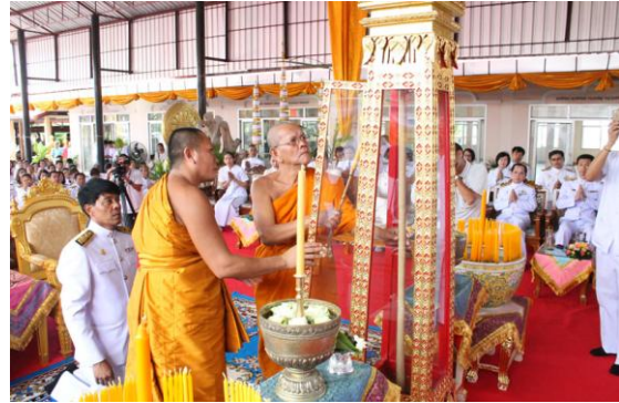
นครราชสีมา