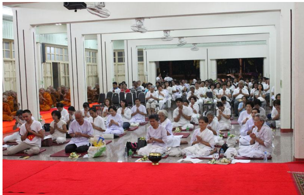
นครราชสีมา