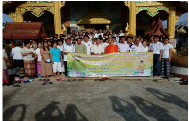
เชียงราย