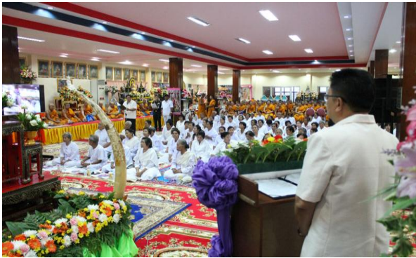
นครราชสีมา