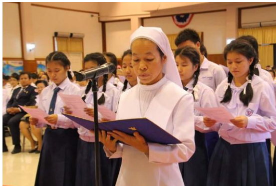
เพชรบูรณ์