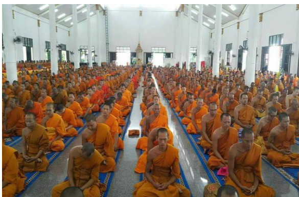
ปทุมธานี