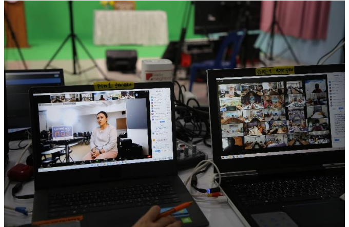
ภาพที่ ๑ และ ๒ การจัดประชุมเชิงปฏิบัติการฯ