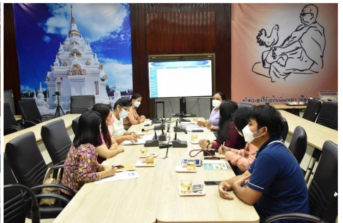
ภาพที่ ๑ - ๔ การประชุมการติดตามผลการดำเนินงานโครงการฯ