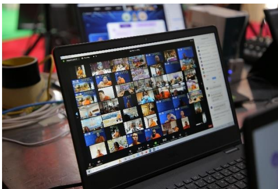
ภาพที่ ๑ การจัดประชุมเชิงปฏิบัติการฯ

กรมการศาสนา ได้จัดประชุมเชิงปฏิบัติการฯ ระหว่างวันที่ ๒๘ มิถุนายน ถึงวันที่ ๑ กรกฎาคม ๒๕๖๕ ณ วัดพระเชตุพนวิมลมังคลาราม เขตพระนคร กรุงเทพมหานคร และผ่านระบบอิเล็กทรอนิกส์ (ZOOM) โดยประชุมร่วมกับสถาบันส่งเสริมและเผยแผ่การพระศาสนาแห่งประเทศไทย และขอความอนุเคราะห์สำนักงานวัฒนธรรมจังหวัดทุกจังหวัดพิจารณาคัดเลือกพระสงฆ์เพื่อเข้ารับการอบรมถวายความรู้ จังหวัดละ ๒ รูป รวมจำนวน ๑๕๒ รูป และคัดเลือกพระสงฆ์ผู้นำในการอบรม จำนวน ๔๘ รูป รวมทั้งสิ้นจำนวน ๒๐๐ รูป