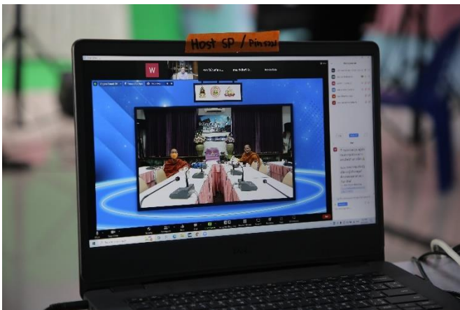
ภาพที่ ๓ ช่องทางแสดงความเห็น ผู้มีส่วนได้ส่วนเสียสามารถแสดงความคิดเห็น ได้ตลอดระยะเวลาการจัดประชุมฯ